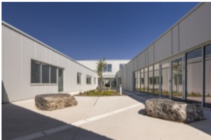
Photo 1 - Centre socio-éducatif à Bourbourg (59)