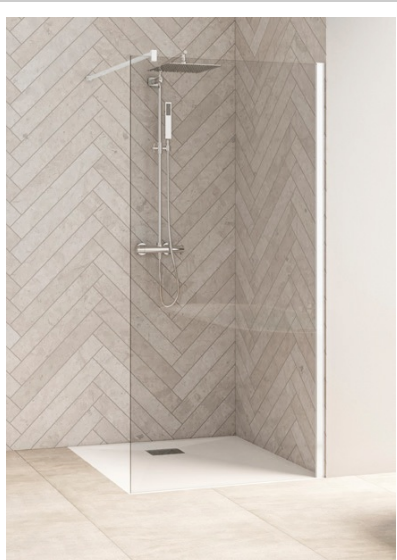
SMART DESIGN SOLO