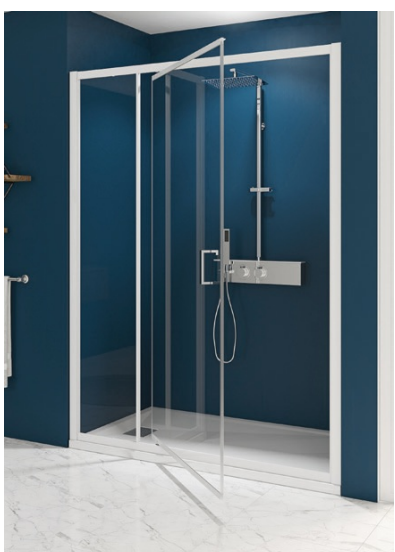
SMART EXPRESS P Montage facile et rapide