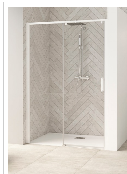
SMART DESIGN C EXTENSIBLE SANS SEUIL