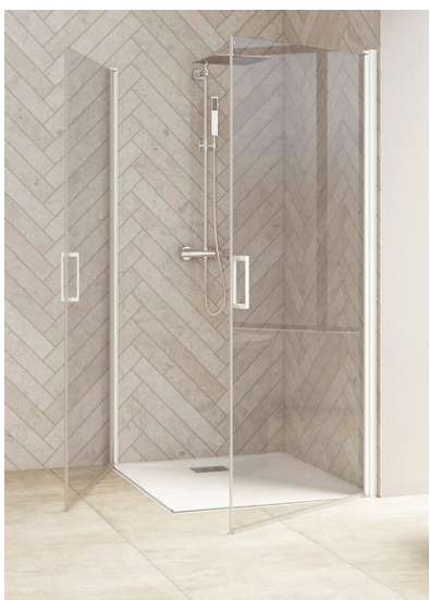
SMART DESIGN A/P SANS SEUIL