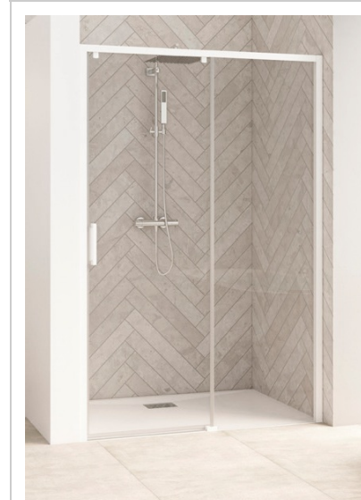
SMART DESIGN C SANS SEUIL