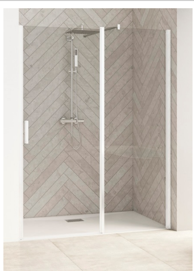
SMART DESIGN P SANS SEUIL