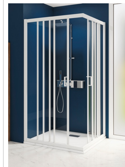
SMART EXPRESS A/2V Montage facile et rapide