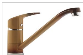
MITIGEUR ÉVIER C2 TERRE DE FRANCE