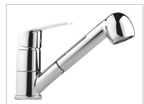
MITIGEUR ÉVIER C2 AVEC DOUCHETTE