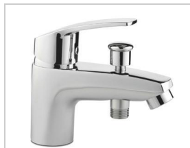
MITIGEUR BAIN- DOUCHE MONOTROU C2