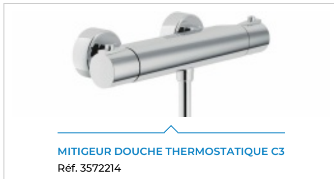
MITIGEUR DOUCHE THERMOSTATIQUE C3