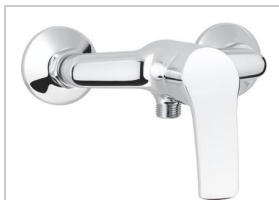
MITIGEUR DOUCHE C2