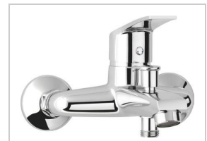
MITIGEUR BAIN- DOUCHE MURAL C2