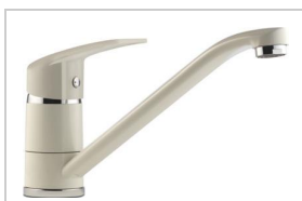
MITIGEUR ÉVIER C2 BLANC