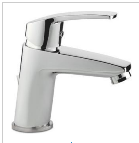
MITIGEUR LAVABO C2/C3