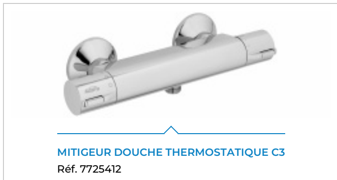
MITIGEUR DOUCHE THERMOSTATIQUE C3