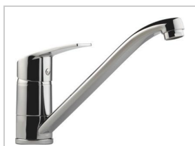
MITIGEUR ÉVIER C2/C3 CHROMÉ